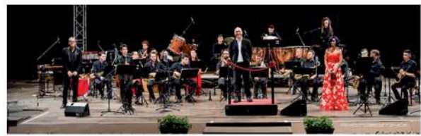
Balarm Sax Orchestra